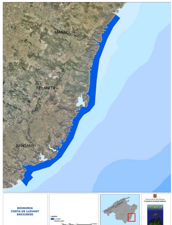
Annex mapa 1

La inspecció, vigilància i control de les matèries objecte d'aquest pla correspondrà a les administracions i òrgans que els tinguin atribuïts. Per a l'efectiva consecució dels objectius d'aquest pla, la conselleria competent en matèria de Medi Ambient promourà els mecanismes de coordinació necessaris amb altres òrgans de l'administració autonòmica, especialment els competents en matèria de pesca, així com amb les altres administracions públiques.